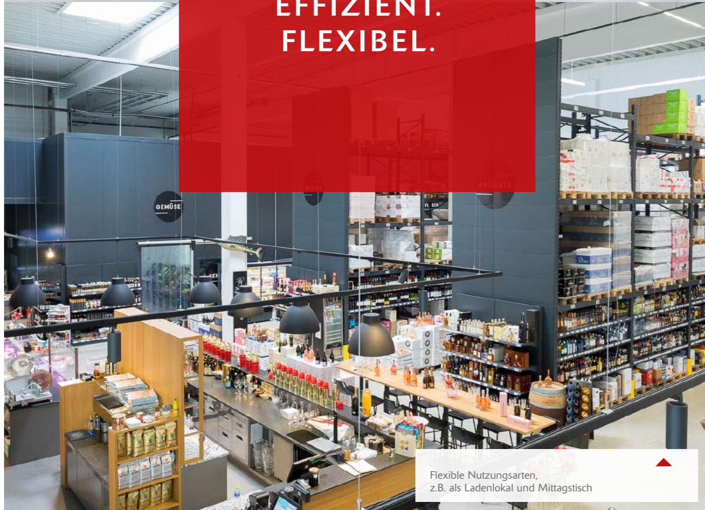
Flexible Nutzungsarten, z.B. als Ladenlokal und Mittagstisch