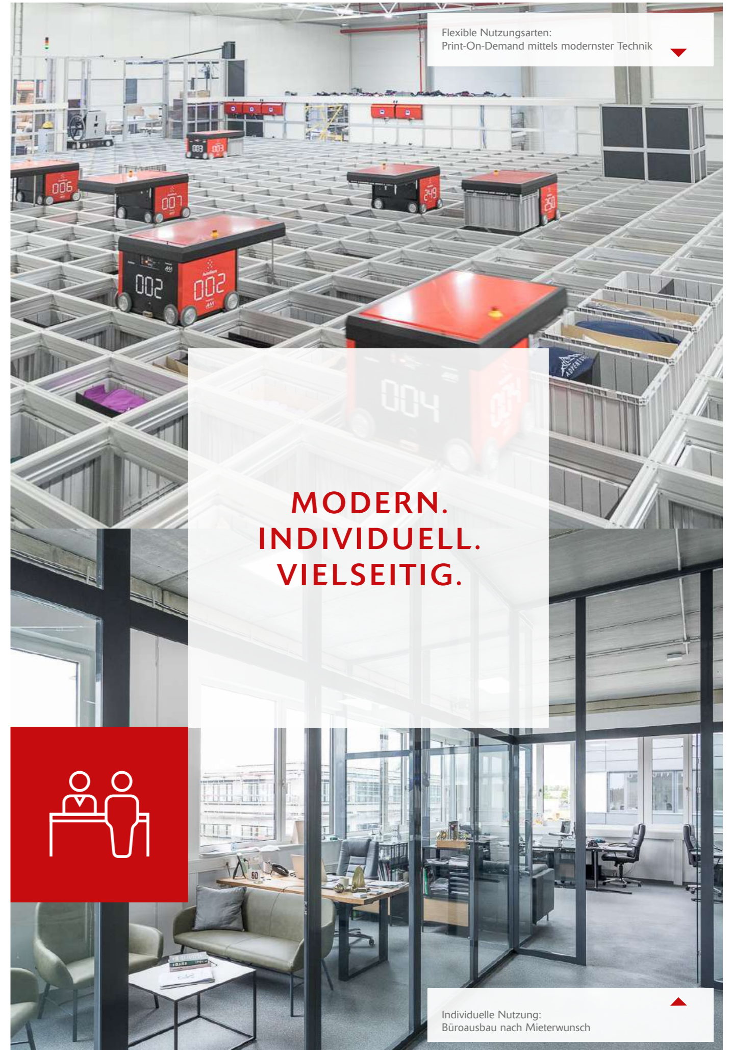
Flexible Nutzungsarten: Print-On-Demand mittels modernster Technik